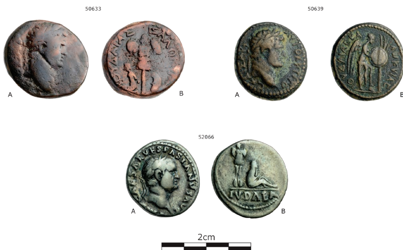
Fig. 2 - Moedas cunhadas com o triunfalismo romano sobre a província da Iudaea.

Sumariamente, a demografia e a paisagem da região foi afetada pelos conflitos de anexação. Em 66 ec., duas legiões com oito esquadrões de cavalaria, sob o comando de Vespasiano foram designadas para o combate aos judeus rebeldes e o restabelecimento da ordem na região. Durante a guerra Vespasiano tornou-se patrono de Flávio Josefo, um dos principais líderes intelectuais da resistência judaica. Num curto intervalo de tempo, entre os anos de 115-117 ec., eclodiu o segundo conflito e a partir de 135 ec. a província passou a ser designada como Syria Palaestina e os judeus foram proibidos de entrar na cidade por um período, bem como expulsos dessa província romana de maneira geral. Contudo, um número significativo da população permaneceu na região e adaptou-se ao novo contexto de controle estabelecido. Moedas comemorativas representando a Judéia capturada foram cunhadas, especialmente por Vespasiano, demonstrando o triunfalismo e controle da região (fig. 2).