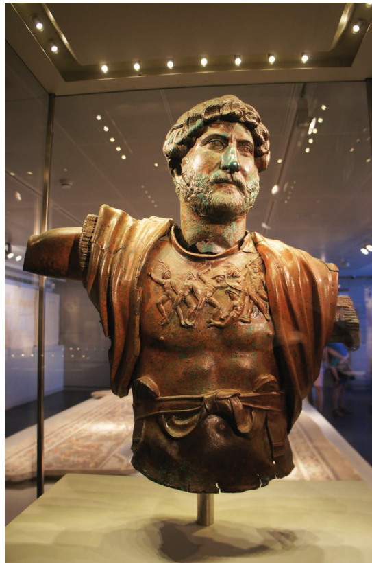
Fig. 1 - Busto do Imperador Adriano no Museu de Israel, Jerusalém. Conhecido nas fontes religiosas judaicas do período como “o moedor de ossos”, foi encontrada em 1975 no que acabou por ser o campo da Sexta Legião Romana em Tel Shalem, perto de Bet She’an, norte de Israel. Somente três bustos do imperador em bronze sobreviveram até nossos dias. Um foi encontrado no Rio Tamisa, Londres, em 1834, pertence ao Museu Britânico. O outro foi encontrado num mercado de antiguidades e está no Museu do Louvre, em Paris. Acredita-se que tenha vindo do Egito ou Ásia Menor.

Simão Bar-Kosba resultou, portanto, numa diminuição demográfica em toda Judaea e com o passar do tempo, a região foi se recuperando dos efeitos causados por esses acontecimentos. Apesar da violenta repressão, opressão fiscal e choque cultural, é no período romano que as cidades da região tornaram-se mais numerosas, maiores e prósperas. Os confrontos nunca foram eliminados por completo, tampouco as revoltas judaicas foram as únicas na região. Entretanto, a ação romana no Oriente Médio foi decisiva e assertiva nesses casos, tornando essas insurreições mais raras.