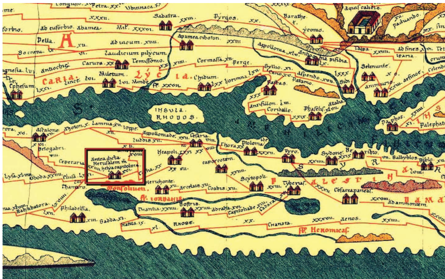
Fig. 3 - Tabula Peutingeriana com destaque para Jerusalem “Aelia Capitolina”.

Embora muitos caminhos usados pelos romanos na construção de suas estradas já fossem utilizados desde os períodos anteriores, a organização de um sistema de vias de tráfego regional projetado em larga escala é fruto do período romano de ocupação. Orientado pelos quatro pontos cardeais, o sistema contava com um alinhamento longitudinal de vias norte-sul e transversal leste-oeste cobrindo a extensão das províncias (fig. 4). Nesse contexto de estruturação romana, Cesareia Marítima desempenhou importante papel como caput viae e para ela convergiam nada menos do que sete viae publicae . As instalações portuárias sofisticadas e o planejamento da cidade, atendendo às necessidades básicas romanas, fizeram com que a cidade figurasse como quartel general do governador romano e seu executivo. As prioridades de comunicação, transporte e suprimentos entre Cesareia Marítima e cidades vizinhas, como Apolônia (Tel Arsuf) e Jafa (Yafo), assim como os acampamentos militares implantados na região, foram contingências não negligenciadas. Desde Jafa, Antipátrida, Neápolis, Samaria, passando por Legio e Acre (Ptolemais), cada uma dessas cidades contava com uma via publica que a conectava diretamente com Cesareia Marítima, contribuindo no desenvolvimento da localidade e da região.