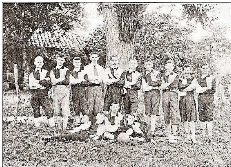
Figura 1: Primeiro time de futebol do Germania (1900).

O clube irmão do Germania de Hamburgo, tão idealizado por Nobiling, finalmente começava a tomar forma. Em seus estatutos, encontramos que o objetivo do clube era promover os esportes de todas as modalidades através de jogos esportivos e corridas, assembleias periódicas, reuniões sociais e excursões. Desde o início, o clube era filiado à Liga Paulista de Foot-ball. Além disso, já no primeiro estatuto encontrado 12 identificamos as especificações de seus primeiros departamentos: o de remo e o de tênis 13 .