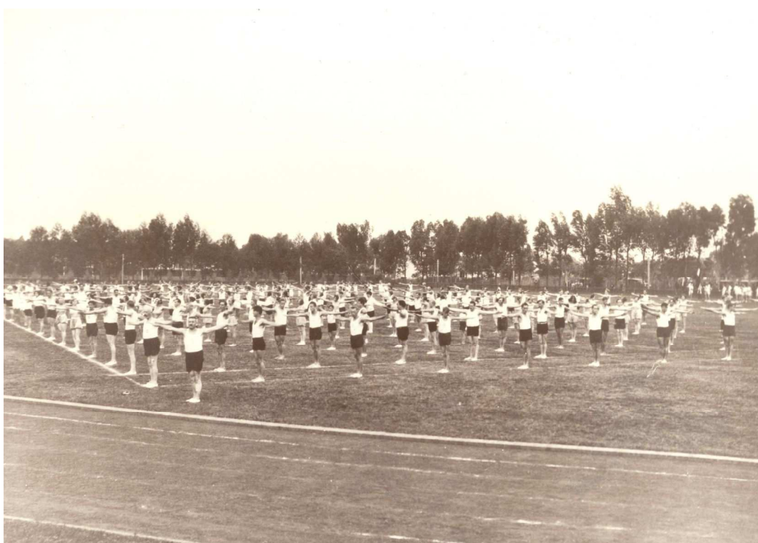
Figura 3: Apresentação de ginástica na antiga pista de atletismo (década de 1920). Centro Pró-Memória Hans Nobiling

a seguir podemos ver uma dessas apresentações. Nota-se que todos os homens, independentemente da idade, usam a mesma vestimenta. As poucas mulheres presentes na apresentação também estão uniformizadas, porém sua roupa é diferente da masculina.