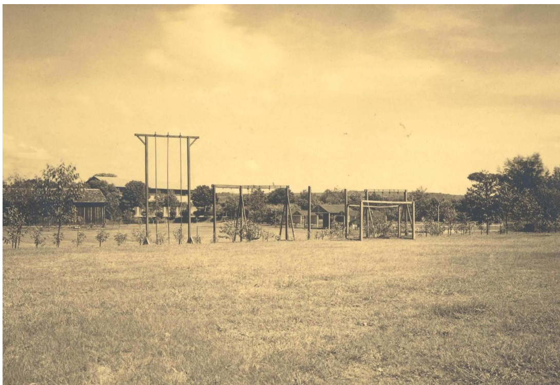
Figura 4: Aparelhos de ginástica no campo do Sport Club Germania (década de 1920).

Contudo, o que nos chama a atenção é que, além do campo de ginástica, outro local do clube possuía aparelhos muito parecidos: o parquinho das crianças. Nele é encontramos aparelhos de grande semelhança com os do campo de ginástica. Assim como os adultos, as crianças também possuíam aparelhos basicamente desenhados para atividades como trepar, além de uma barra para exercícios de suspensão.