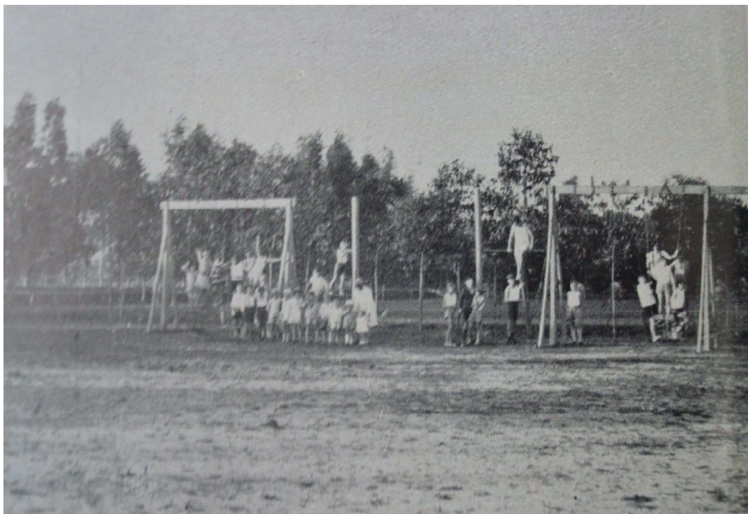
Figura 5: Foto do parquinho das crianças. Revista Sport Club Germania, 1929. Instituto Martius-Staden

A análise das imagens do local de brincadeiras das crianças e da foto dos aparelhos de ginástica nos leva a crer, entretanto, que ambas as imagens são do mesmo local, porém tiradas de ângulos diferentes. Na revista Sport Club Germania de 1929, encontra-se a foto com a legenda Kinderspielplatz, ou seja, local de brincadeira das crianças. Já a fotografia dos aparelhos de ginástica, cedida pelo Centro Pró-Memória Hans Nobiling, traz como descrição da foto “aparelhos de ginástica no campo do Germania (entre 1920 e 1930)”. Podemos observar que os aparelhos são semelhantes àqueles desenvolvidos durante o século XIX para a execução de exercícios ginásticos. A surpresa, porém, é ver que não eram tratados como aparelhos para ginástica, mas sim como um local de brincadeira para as crianças. Seria a ginástica, no Germania, voltada majoritariamente para as crianças como forma de prepará-las para a posterior prática esportiva? Sabemos da preocupação do clube com a formação de seus jovens, explícita principalmente pela existência do “Departamento de Jogos e Ginástica para os Jovens”. A própria imagem da apresentação de ginástica no campo do Germania nos traz um significativo número de jovens e algumas crianças em meio aos adultos. Podemos pensar, portanto, que os exercícios