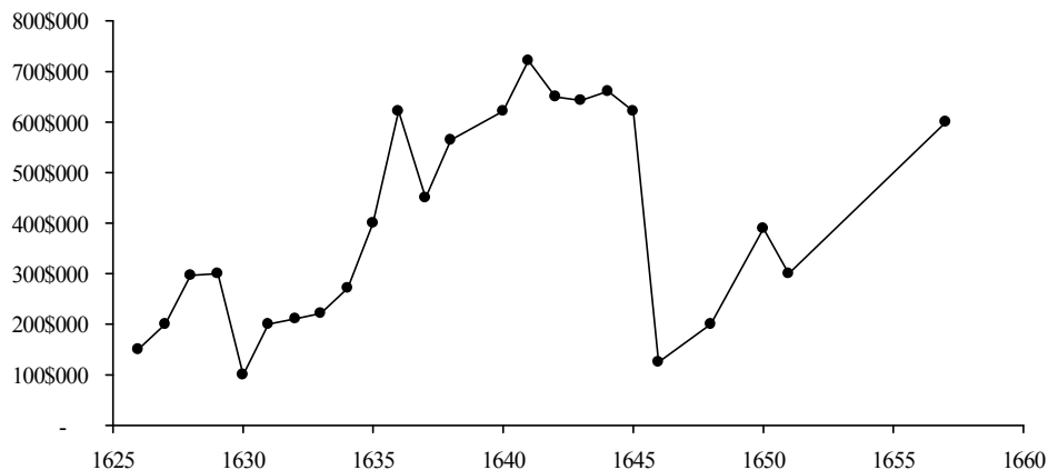
Gráfico 1: Renda do verde, 1626-1657

Fonte: Documentos Históricos do Arquivo Municipal: Atas da Câmara, vs. 1-3