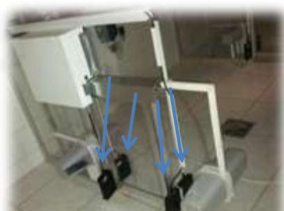
FIGURA 2. Visão lateral da porta de passagem para aves entre compartimentos - em destaque os dois pares de antenas instalados, um par em cada lado da porta.

projetada a fim de minimizar a troca de ar de um compartimento para o seu adjacente, garantindo estabilidade ambiental (JONES et al., 2005) (Figura 2).