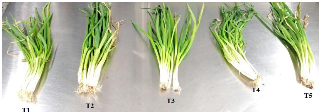
Figura 3. Aspecto visual das amostras sob diferentes tratamentos aos 9 dias de armazenamento

A perda de massa nas hortaliças folhosas gera queda acelerada da qualidade, sendo o murchamento e o enrugamento os principais indicativos da perda de água, podendo acelerar a deterioração pelo aumento da taxa de reações (Travassos, et al. , 2017). Foram observadas mudanças significativas nos aspectos visuais das cebolinhas quanto ao murchamento e ao enrugamento, tendo as amostras T3 se mantido atraentes até o último dia de análise (Figura 3). Entretanto, não houve diferença significativa na cor das amostras, conforme os índices de clorofila e também observado por Travassos et al (2017).