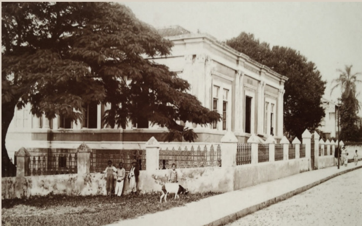
Imagem 2 - Escola Corrêa de Mello – 1900