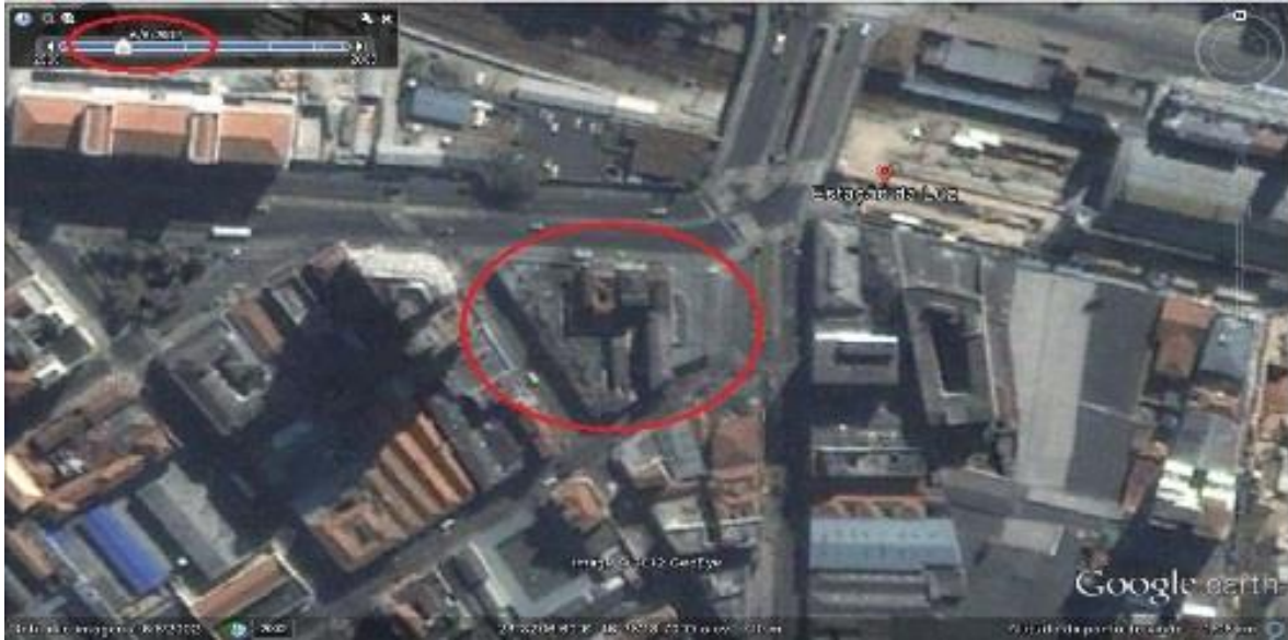
Figura 7: Representação de área contígua à Estação da Luz, entre a Rua Mauá, Rua General Couto de Magalhães, Rua dos Gusmões e Rua dos Protestantes. Recorte do ano 2004.