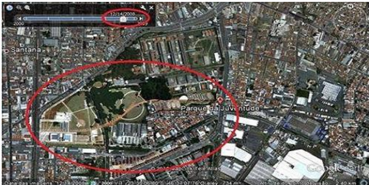
Figura 5: Representação da área do Parque da Juventude, antiga Casa de Detenção do Estado, recorte do ano 2009.