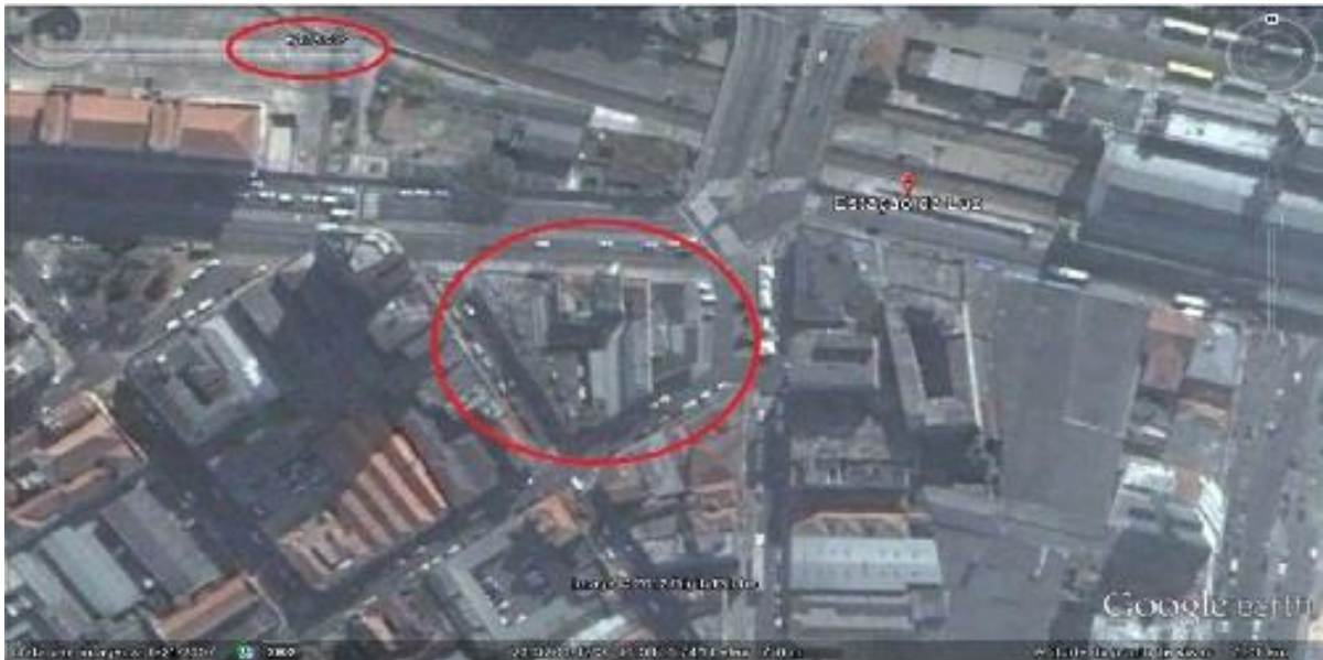
Figura 9: Representação de área contígua à Estação da Luz, entre a Rua Mauá, Rua General Couto de Magalhães, Rua dos Gusmões e Rua dos Protestantes. Recorte do ano 2008.