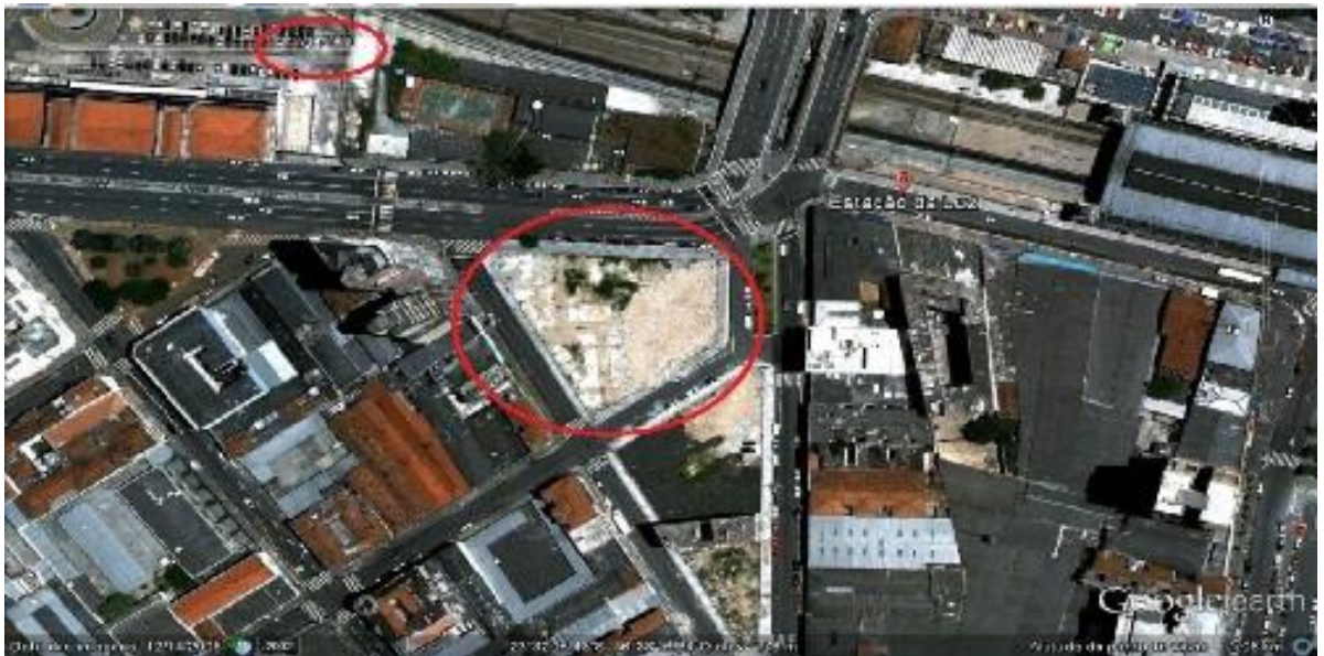
Figura 10: Representação de área contígua à Estação da Luz, entre a Rua Mauá, Rua General Couto de Magalhães, Rua dos Gusmões e Rua dos Protestantes. Recorte do ano 2009.